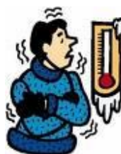
4. hace frío